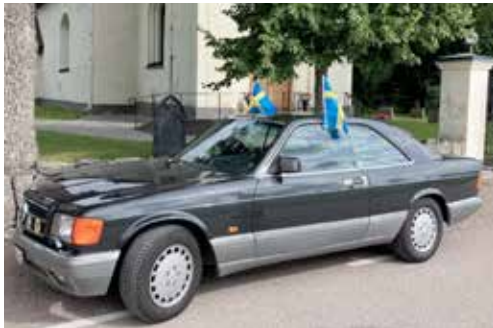
Nils Andersson klenod en Mercedes 500 SEC 1989 års modell.

Nils eget bilintresse bestod egentligen av ett enda märke, nämligen Mercedes.