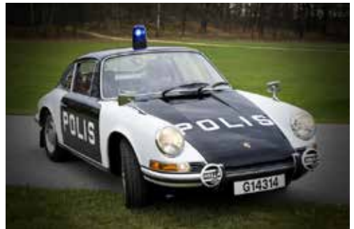
Polismuseets exemplar av Polisporsche

Nedtecknat i september 2025, Åke Henriksson