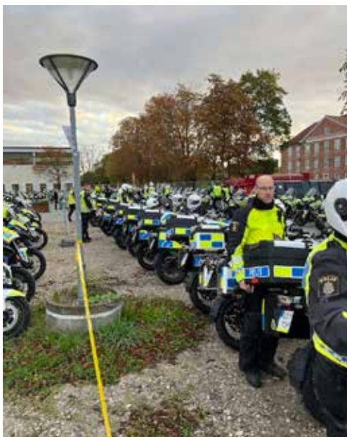
Samtliga mc i ekortstyrkan uppställda vid Gröndahl logistikcenter