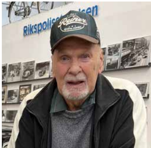
Reiner under sitt besök på Polismuseet i Tullinge 2025.

en service på VW-Forum i Södertälje. De fick därför göra en inkörningsresa till Söderhamn och tillbaka. Hastigheten fick ej överstiga 70 km/h.