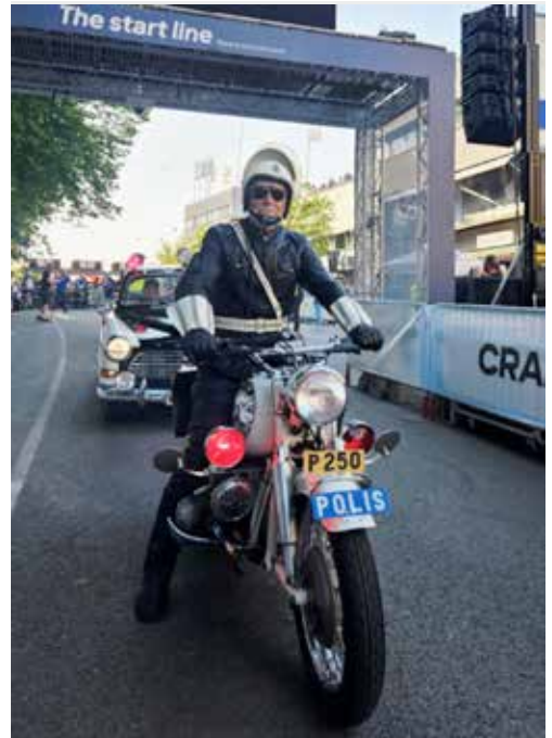
I väntan på start framför första startgrupp.

Vår medverkan blev en bejublade succé. Jag har aldrig blivit så fotograferad som den kvällen. Snudd på besvärligt.