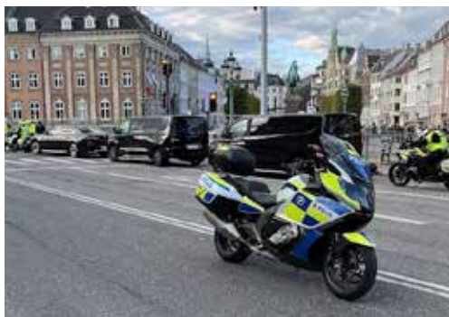
Väntan utanför Christiansborg

Det sista halvåret 2025 tog Danmark över ordförandeskapet i Europeiska unionens råd, även kallat ministerrådet. Då det planerats ett större möte i Köpenhamn på ministernivå hemställde Danmark om en resursförstärkning från Sverige och Norge för att säkerställa förmågan vid de förväntade eskortuppdragen. Man behövde med andra ord hjälp av mc-poliser eftersom 65 medlemsländer hade bjudits in till ett möte i början av oktober.