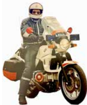
Mc-polis: Artikelförfattaren i egen hög person.

Detta är ett utdrag från en längre artikel av Ulf Malmqvist. Artikeln finns att läsa i sin helhet på Mc-polisveteranernas hemsida .